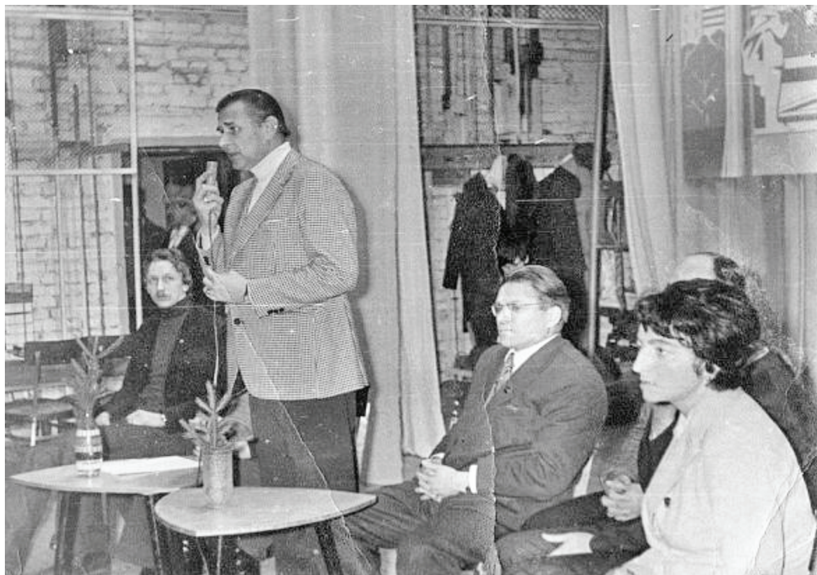
Встреча с Львом Яшиным в клубе чугунолитейного завода (ныне - районный ДК).