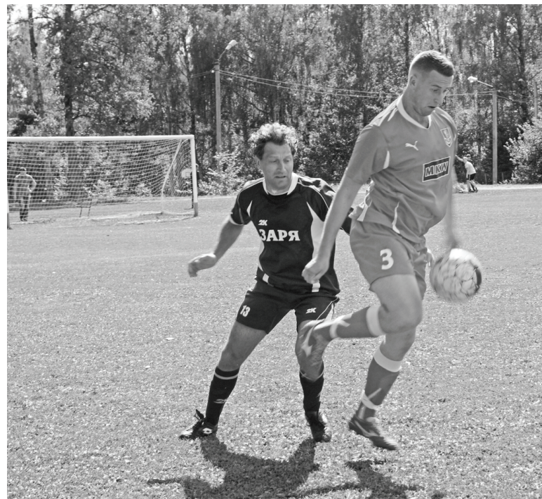
Через секунду «Заря» «приберет мяч к своим ногам», и начнется голевая атака.