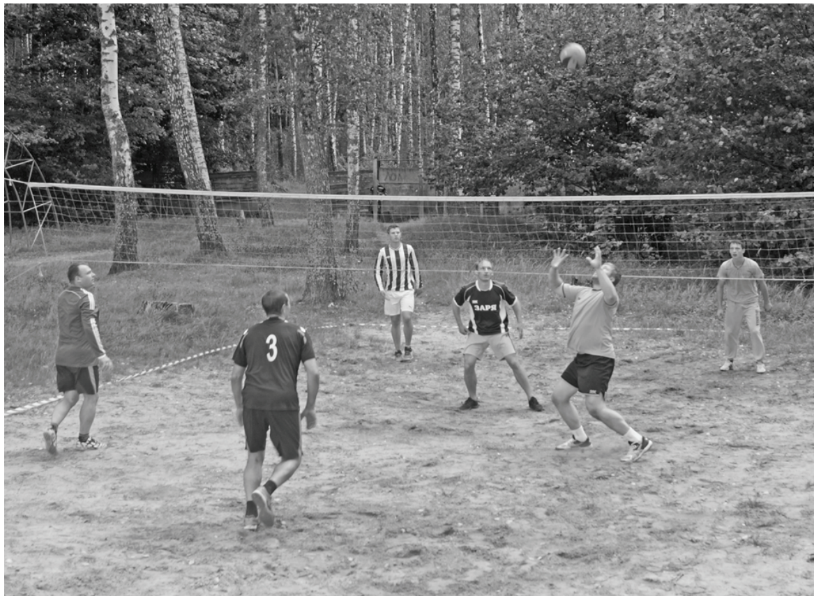
Волейбол — один из самых популярных у думиничан видов спорта.

Следующий матч «Заря» проводит 20 августа на выезде против «Авангарда» (Перемышль). Игра начнется в 17.00. До новых спортивных встреч!