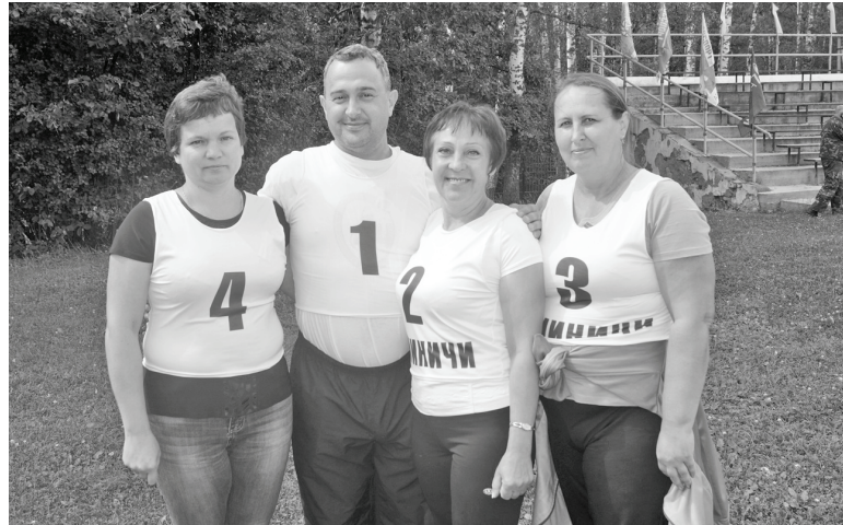
Депутаты - за спорт!